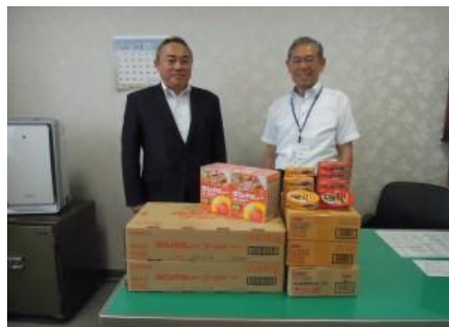
八幡浜福祉協議会へ売上の一部をフードドライブとして協力しました。